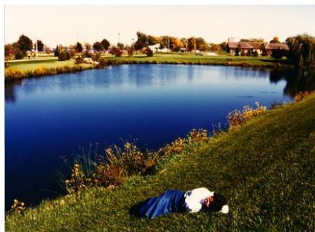
此生的第一个永恒湖